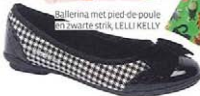
Ballerina met pied-de-poule en zwarte strik, LELLI KELLY