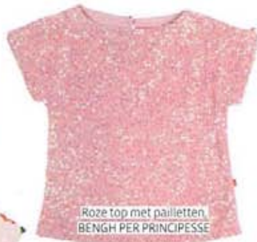
Roze top met pailletten, BENGH PER PRINCIPESSE