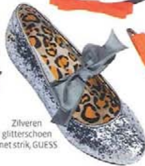
Zilveren glitterschoen met strik, GUESS