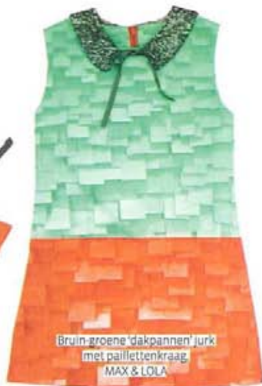
Bruin-groene 'dakpannen' jurk met paillettenkraag, MAX & LOLA