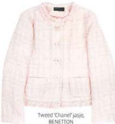
Tweed 'Chanel' jasje, BENETTON