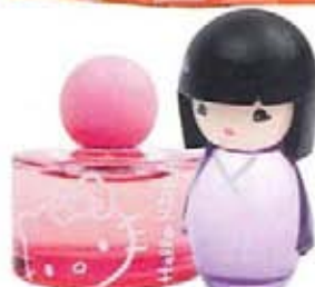
Eau de Toilette, HELLO KITTY