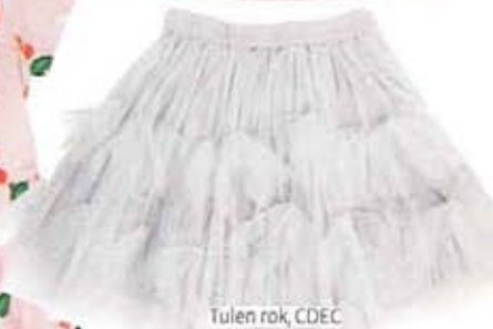
Tulen rok, CDEC