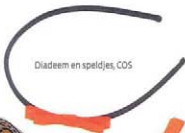
Diadeem en speldjes, COS