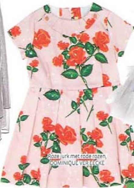
Roze jurk met rode rozen, DOMINIQUE VEREECKE