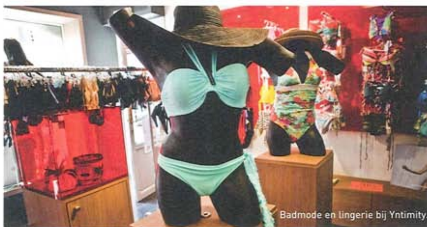
Badmode en lingerie bij Yntimity.