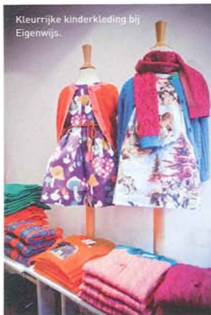
Kleurrijke kinderkleding bij Eigenwijs.