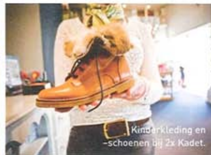
Kinderkleding en -schoenen bij 2x Kadet.