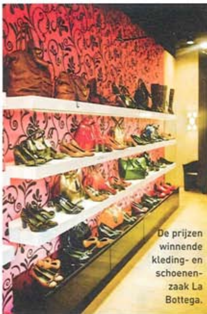
De prijzen winnende kleding- en schoenenzaak La Bottega.